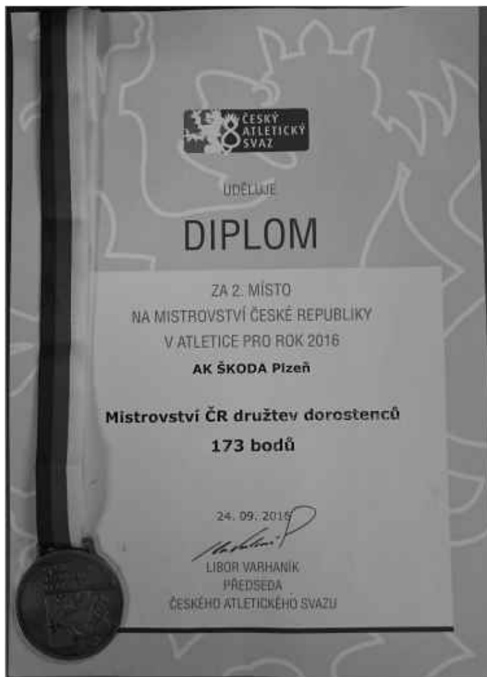
MR v atletice v Ostravě 24.9.2016

I pro naše město může být hřejivé, že nám tady zraje možná jednou velmi nadaný a zdatný sportovec, který veškerý volný čas věnuje sportu.