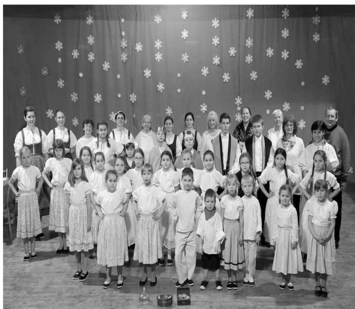
Vánoční vystoupení v Domě kultury v Teplé 16. 12. 2016