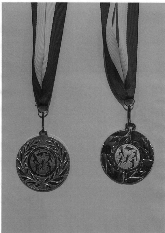
Medaile z mezikrajoých mistrovství - 2. místo za desetiboj a 3. místo za skok do dálky