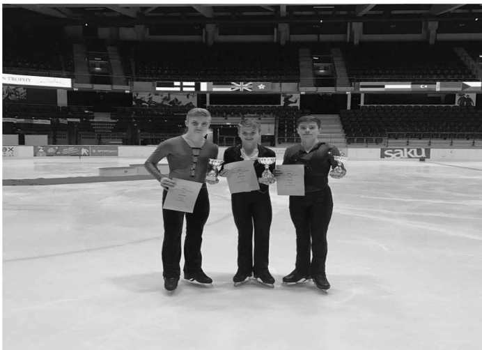
Tallinn Trophy 2016