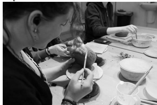
Tvoření v keramické dílně

Cena včetně materiálu 600 Kč/os, děti 300 Kč/os. pouze v doprovodu dospělého. Rezervace nutná. Bližší informace a rezervace na tel: 774 334 491, e- mail: kozakova.klaster@gmail.com