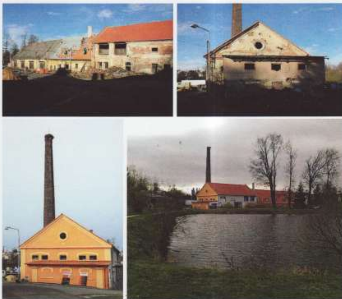
č.p. 213 bývalý městský pivovar

K objektům, které významným způsobem dotváří prostředí kulturních památek patří i čp.213